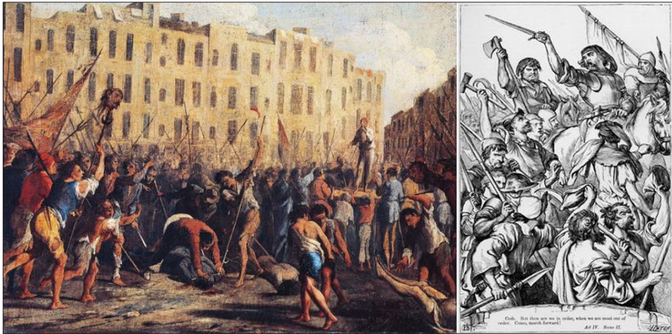
A sinistra, “Uccisione di padre Giuseppe Carafa”, 10 luglio 1647, di Domenico Gargiulo, Rivolta di Masaniello, Museo Nazionale della Ceramica 'Duca Di Martina'; a destra H.C. Selous' illustration of the Cade Rebellion in Act 4, Scene 2; from “The Plays of William Shakespeare: The Historical Plays”, edited by Charles Cowden Clarke and Mary Cowden Clarke (1830)