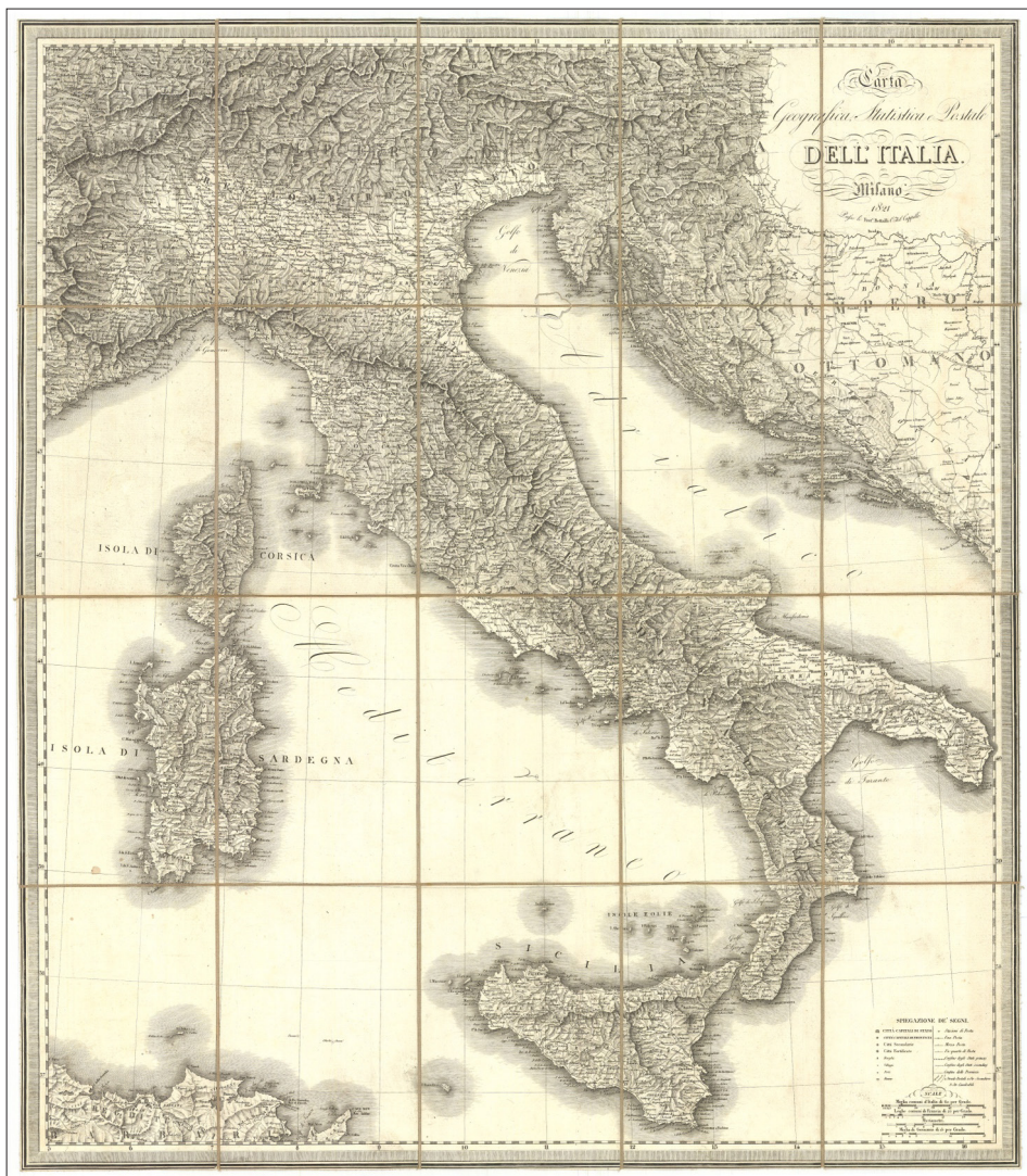
Fig. 2 S. Stucchi, Carta Geografica, Statistica e Postale dell'Italia , 1821

una partizione gerarchica delle città in base al loro ruolo amministrativo, militare e al peso demografico. All'inquadramento infrastrutturale e amministrativo-demografico si somma l'aspetto topografico, che emerge dall'accurata descrizione del rilievo e del profilo costiero, volta a definire il contenitore geografico del quadro statistico. L'Italia come regione, espressione geografica appunto, si definisce così ben prima che il progetto politico dell'Unità nazionale sia compiuto e coincide con